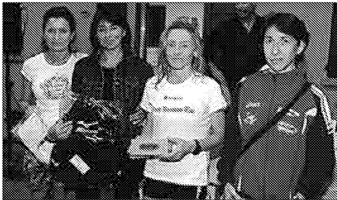
Le premiazioni femminili della Four Season Run a Borzano

La kermesse è stata organizzata dalla Pol. Borzanese presso il centro sportivo "I Manfredi", ed è stata contraddistinta dalla massiccia presenza in gara di donne.